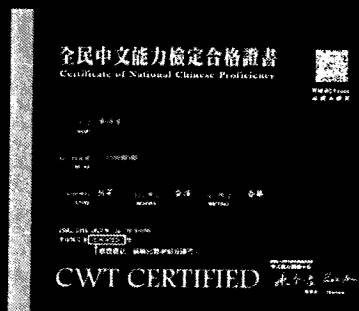
※初~中高等證書證號示意圖