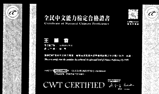
※高、優等證書證號示意圖